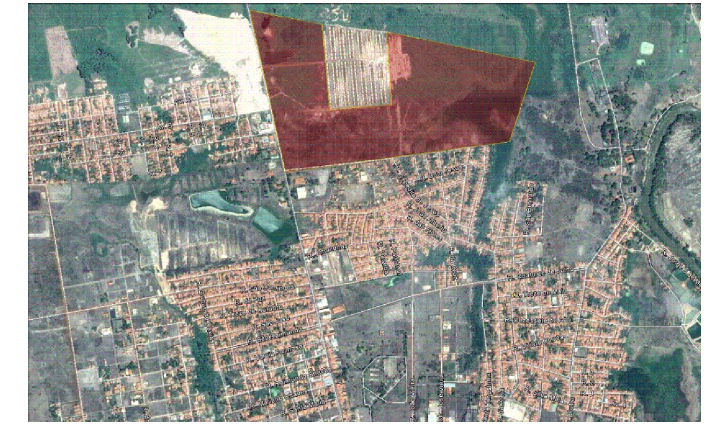
02 PLANTA DE LOCALIZAÇÃO A01 ESCALA S/E